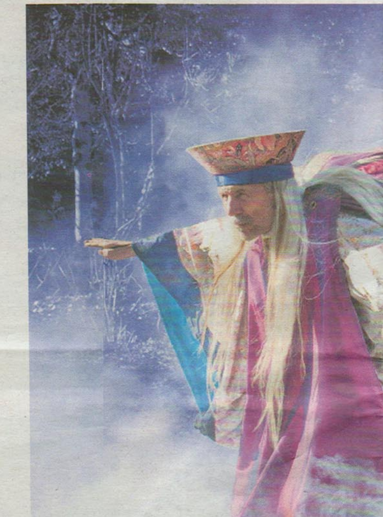
Theatergroep Hria met Fata Morgana.