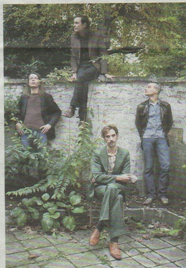
De Belgische groep DAAU.